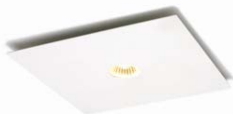
VENTIEL MET SPOTVERLICHTING