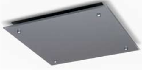
VENTIEL MET GLASCOATING