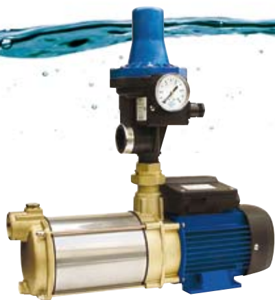
Pomp Aspri inclusief KIT-02